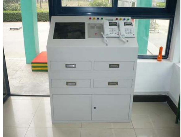
武警哨位信息化执勤台功能描述图：