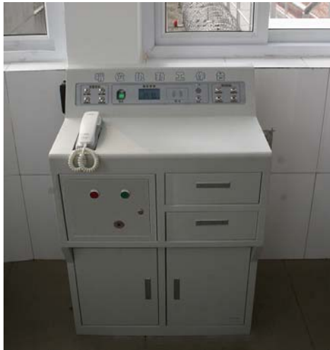
武警哨位信息化执勤台现场效果图：